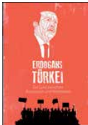
Erdogans Türkei - Ein Land zwischen Repression und Widerstand | Textsammlung | 120 Seiten, 6,50 Euro | ISBN 978-3-947240-05-0 | 2017